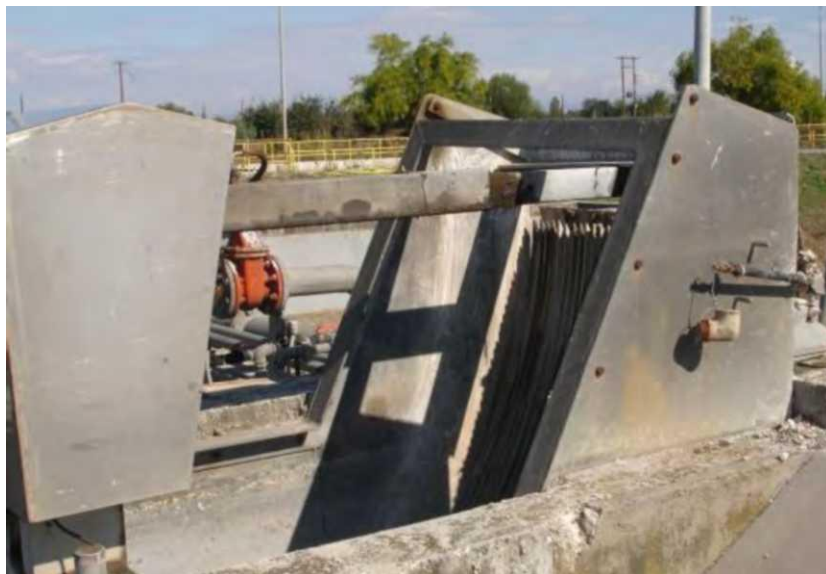
Εικόνα : Φωτογραφία της μηχανοκίνητης τοξωτής εσχάρας

Ανάτη του καναλιού της υδραυλικής εσχάρας υπάρχουν ξυλοσανίδες απομόνωσης. Σε περίπτωση βλάβης ή έμφραξης της υδραυλικής εσχάρας η διάταξη των καναλιών επιτρέπει την αυτόματη υπερχειλίση των λυμάτων από το κανάλι της υδραυλικής εσχάρας στο κανάλι της χειροκαθαριζόμενης εσχάρας.